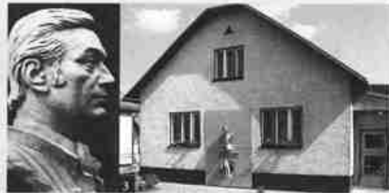
Majcichov s rímskokatolíckou farou a miestom posledného odpočinku Jána Palárika (minulosť a dnešok).