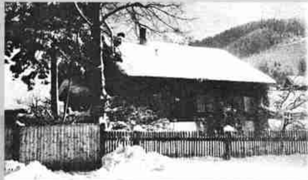
Horáreň na Bystriciach, kam chodil Rudo Moric (dnes už nestojí).