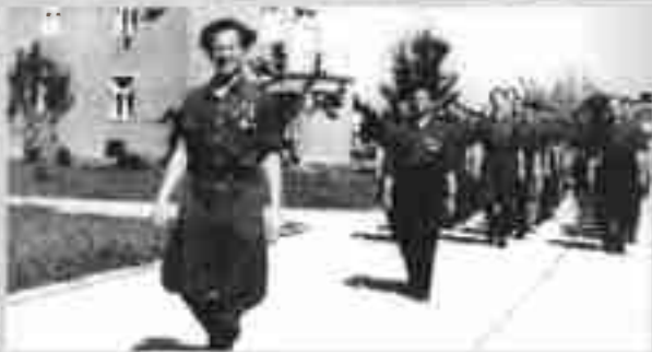
Rudolf Jašík počas druhej svetovej vojny bol partizánom. Za zásluhy v odboji mu boli udelené viaceré vyznamenania.