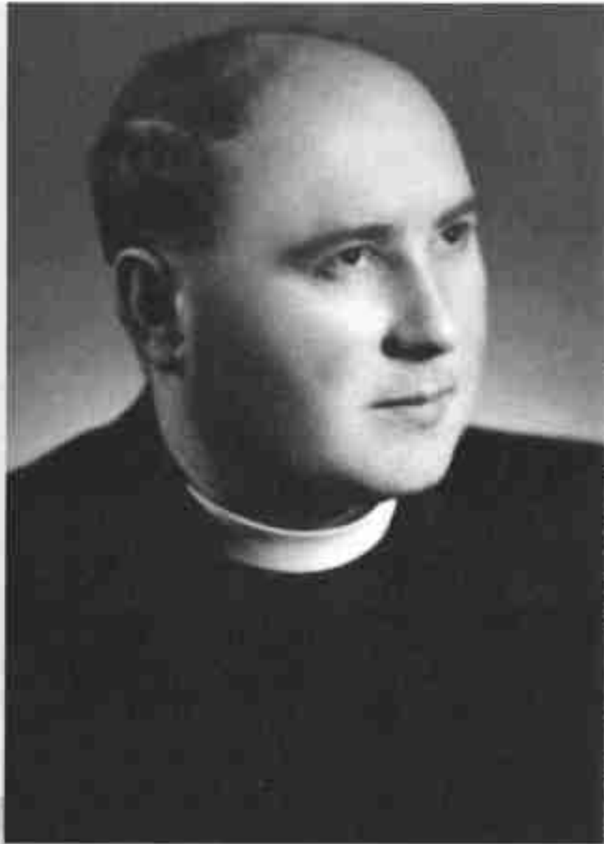
kňaz, básnik a prekladateľ

Narodil sa 3. 12. 1909 v Turzovke. Zomrel 27. 3. 1983 vo Svinnej.