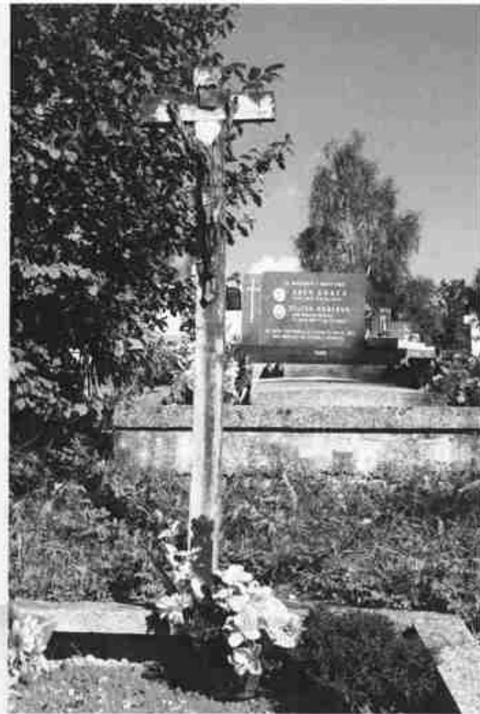
Miesto posledného odpočinku v Starej Bystrici.