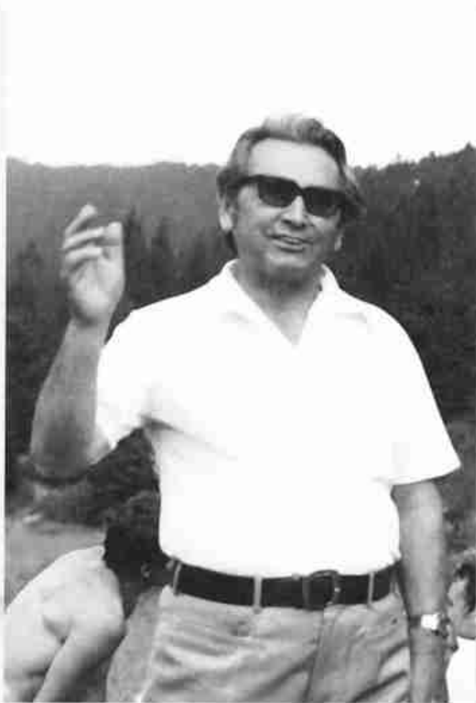
Na výlete s priateľmi.